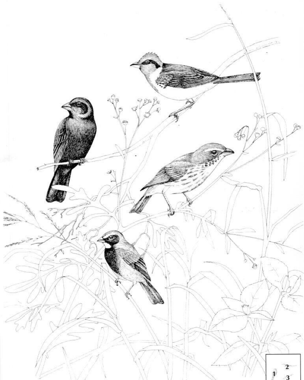
1. Azulón Ultramarino, 2. Cardenal Pantanero, 3. Saltátor Pio-judío, 4. Semillero Cariamarrillo.