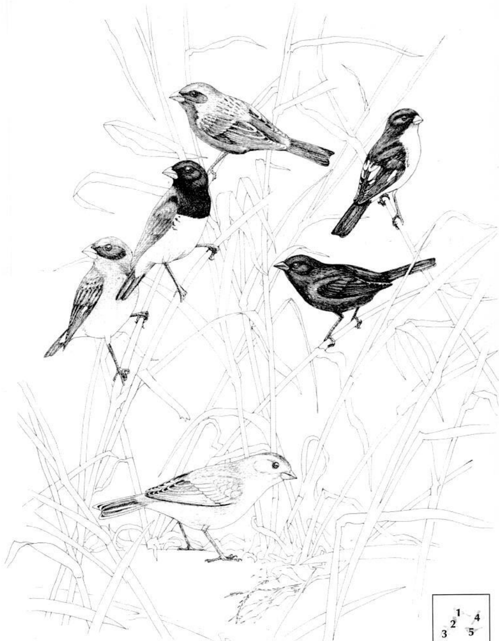
1. Espiguero Ladrillo, 2. Espiguero Capuchino, 3. Espiguero Gris, 4. Jilguero Aliblanco, 5. Volatinero Negro, 6. Sicalis Coronado.